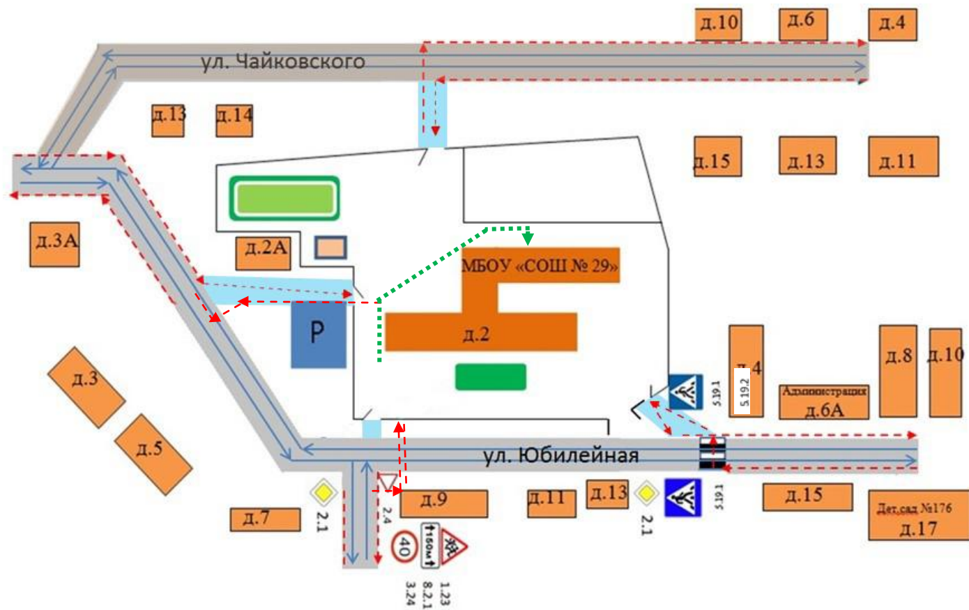
Схема организации дорожного движения в непосредственной близости от МБОУ «СОШ №29» с размещением технических средств, а также маршруты движения детей.